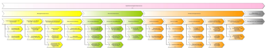
ISO 9000 Prozessbibliothek